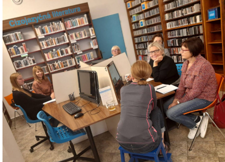
Kurz práce s výpočetní technikou